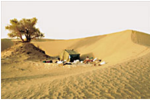
Camp in der Wüste