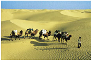
Durchquerung der Taklamakanwüste