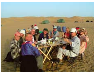
Unterwegs in der Wüste