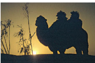
Schönheit und Stille der Wüste