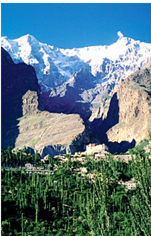
Karimabad mit den beiden Gipfel des Ultar im Hintergrund