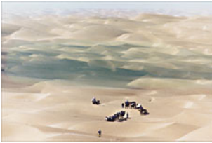
Die erste Intertreck-Gruppe 1999 bei der Durchquerung der Taklamakan-Wüste.