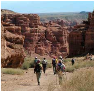
Charynschlucht Kasachstan